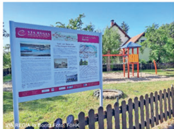
VIA REGIA in Boritz

Neben dem Elberadweg führen der Hirschsteiner Mühlenradweg und der Lommatzscher Rundweg durch die Gemeinde Hirschstein. Der Mühlenradweg verbindet auf ca. 25 km Länge fast alle Ortsteile von Hirschstein und die Standorte der einstmals vorhandenen Mühlen. Die Turmholländer Windmühle in Pahrenz sowie die Windmühle in Schänitz sind die zwei noch erhaltenen Mühlen am Weg. Bei schönem Wetter laden im Sommer in Pahrenz das Museum und der Mühlengarten zum Verweilen ein.