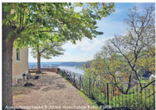
Aussichtsterrasse Schloss Hirschstein

Hoch über der Elbe und dem Elberadweg thront auf einem markanten Felsen das Wahrzeichen von Hirschstein, das gleichnamige Schloss. Bis Anfang Oktober betreuen Ehrenamtliche immer Sonntagnachmittag den Infopunkt im Schloss. Zu dieser Zeit ist auch die Schlossterrasse mit herrlichem Blick ins Elbtal geöffnet. Alljährlich am Tag des offenen Denkmals lädt die Gemeinde zum Weihnachtsmannwecken ein. Groß und Klein freuen sich, wenn sie dem Weihnachtsmann bereits im September begegnen. Unser Stempelkasten von GERSTINs Entdeckertour befindet sich im Vorhof des Schlosses am Kulturboden. Für Familien ist der Waldspielplatz unweit des Schlossareals ein schönes Ausflugsziel. Unterhalb des Schlosses lädt die Gaststätte „Zum Alten Brauhaus“ ihre Gäste ein.