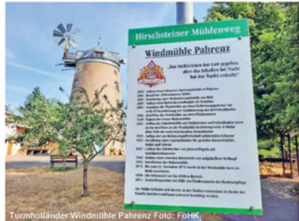
Turmholländer Windmühle Pahrenz

Neben dem Elberadweg führen der Hirschsteiner Mühlenradweg und der Lommatzscher Rundweg durch die Gemeinde Hirschstein. Der Mühlenradweg verbindet auf ca. 25 km Länge fast alle Ortsteile von Hirschstein und die Standorte der einstmals vorhandenen Mühlen. Die Turmholländer Windmühle in Pahrenz sowie die Windmühle in Schänitz sind die zwei noch erhaltenen Mühlen am Weg. Bei schönem Wetter laden im Sommer in Pahrenz das Museum und der Mühlengarten zum Verweilen ein.