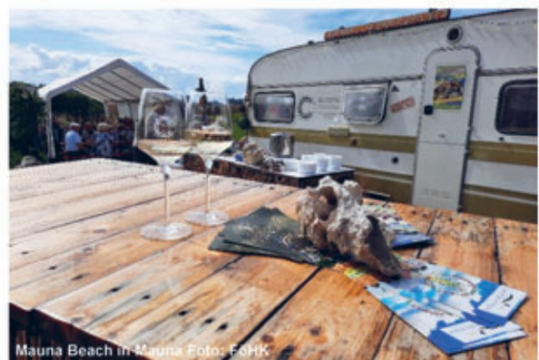
Mauna Beach in Mauna

Nur ca. 4 km von Lößthain entfernt kommt man zur Stempelstation der Entdeckertour am Wildgehege im Park der Generationen in Niederjahna. Durch das Engagement der Einwohner ist der ehemalige Rittergutspark zu einem Platz der Erholung und Muße geworden. Unter dem Motto „Jeder Mensch erzählt eine Geschichte“ wurden einige Dorfbewohner ausgewählt und von lokalen Künstlern als Holzskulpturen dargestellt. Die Menschen hinter den Figuren erzählen in Interviews ihre Geschichte und vertreten symbolisch das Dorf. Der Parkbesucher erlebt den Ort aus einer völlig neuen Perspektive. Das Café Sammelkasse unweit vom Park lädt am Wochenende zu einer kleinen Pause ein, ebenso ein Spielplatz für die Kinder.