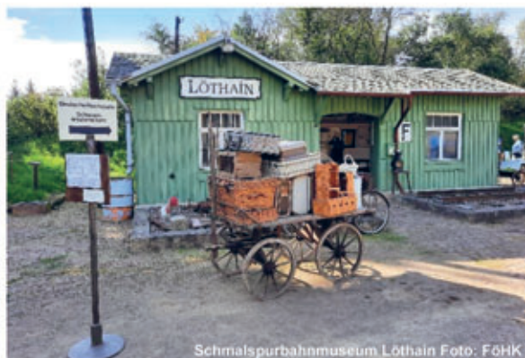
Schmalspurbahnmuseum Lößthain

Entlang der ehemaligen „Rübenbahn“ von Wilsdruff nach Gärtitz sind nach nunmehr 50 Jahren seit der Betriebseinstellung immer noch verschiedenste Relikte der Zugstrecke zu entdecken: sei es eines der Bahnhofsgebäude hier, ein Gleisstrang dort oder eine der zahlreichen Brücken. Ein engagierter Verein kümmert sich liebevoll um die Dauerausstellung zur Eisenbahngeschichte der Lommatzcher Pflege sowie eine kleine, aber feine Sammlung historischer Eisenbahnfahrzeuge im Schmalspurbahnmuseum in Lößthain. So manche Kindheitserinnerung an das Zugfahren in vergangener Zeit wird hier wach. Jeweils am 1. Mai und am 3. Oktober organisiert der Verein geführte Wanderungen auf den Spuren der Schmalspurbahn. So ist man aktiv unterwegs und erfährt auf unterhaltsame Weise viel Wissenswertes rund um die Rübenbahn und die Ortsteile.