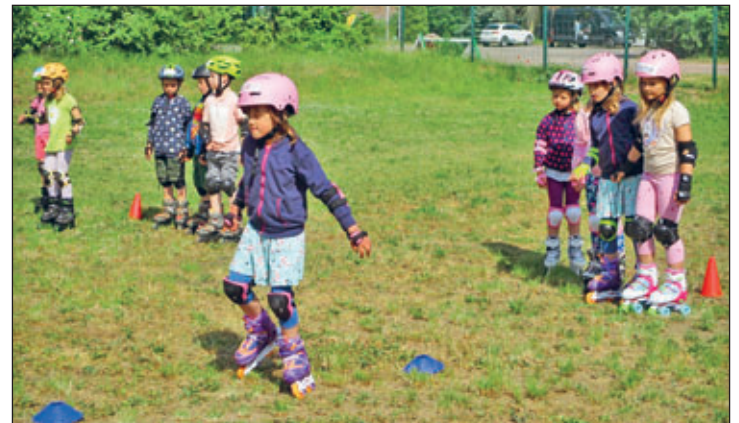
Sonnige Grüße von Ihren „Zwergen“ und dem Johanniter-Kinderhaus „Zwergenland“-Team